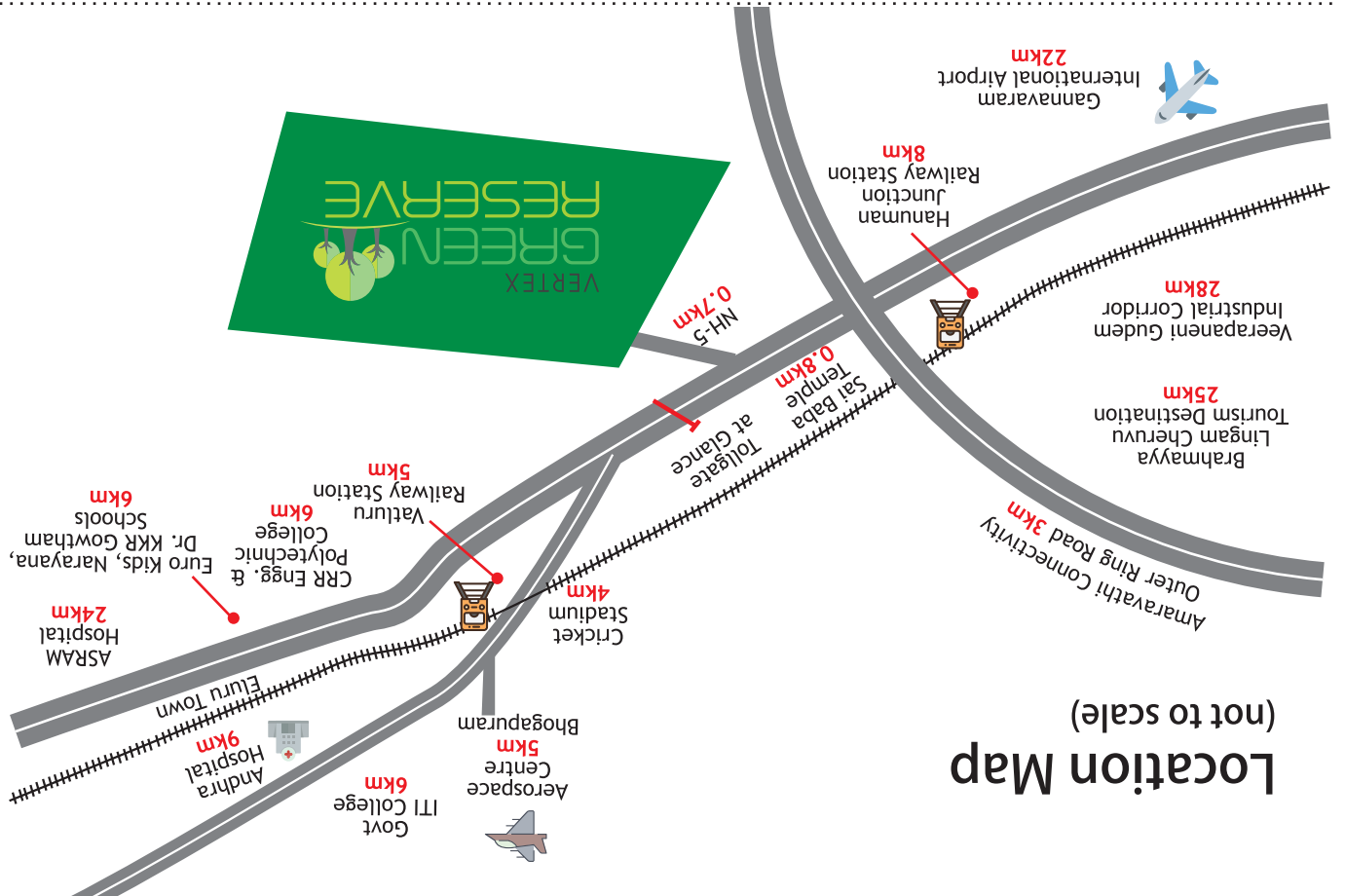
(not to scale) Location Map

VERTEX GREEN RESERVE కలపర్లు, నేషనల్ హైవే 5