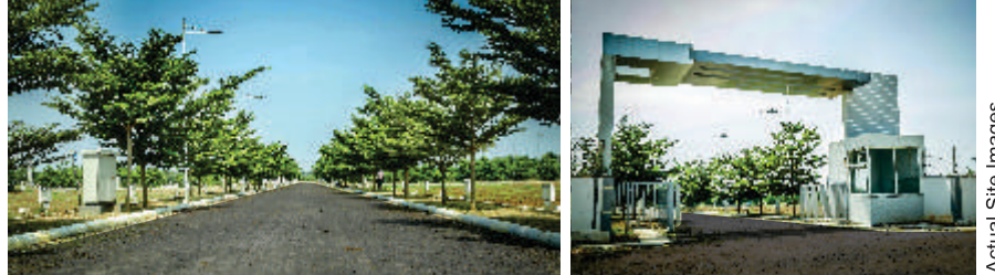
Actual Site Images

ఐదో నంబరు జాతీయ రహదారికి అత్యంత సమీపంలోని అందమైన ప్రకృతికి ఆటపట్టయిన 17.70 ఎకరాలలో, ఆకుపచ్చని పరిసరాల్లో ఆఫోడకర జీవనశైలికి కాలపర్లులో రూపుదిద్దుకున్న వెర్టెక్స్ గ్రీన్ రిజర్వ్ మీకు ఎంతో అనుకూలమైన నివాసం. ఏలూరు-బిజయవాడ కారిడార్ లోని హనుమాన్ జంక్షన్ కు, స్టార్డ్ సిటీ ఏలూరుకు చేరువగా ఉన్న ఈ పూర్వోత్తక ప్రాంతం మీ పెట్టుబడిని అద్భుతంగా పెంపొందిస్తుంది. 147 చ.గ. నుంచి 610 చ.గ. వరకు ఇళ్ళ స్థలాలు అందుబాటులో ఉన్నాయి.